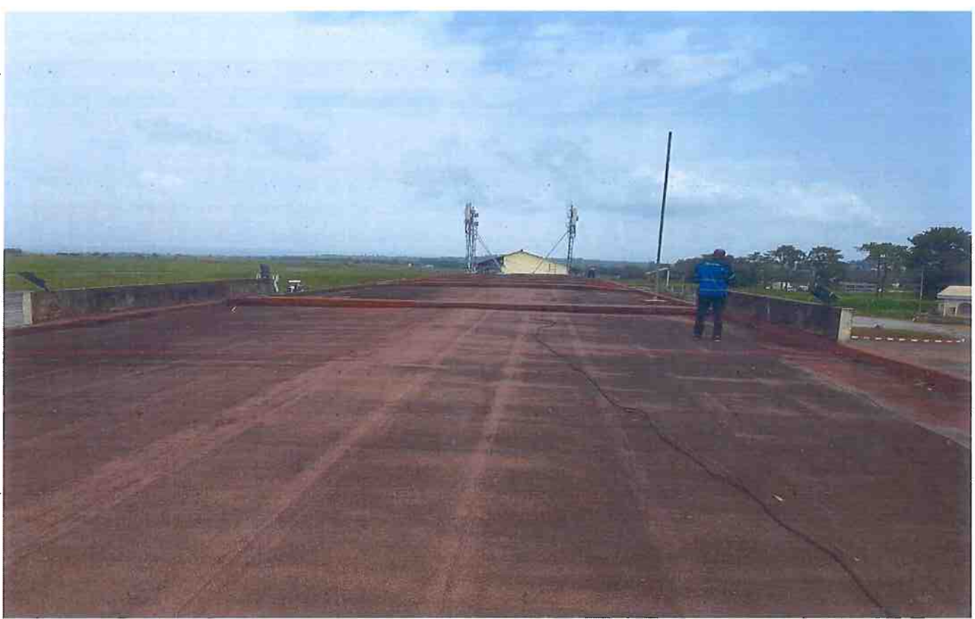
Image du complexe d'étanchéité vieillissant

Les causes des infiltrations d'eau observées sont dues au vieillissement de du revêtement existant, les faibles pentes d'évacuations et le vieillissement des conduites d'évacuation présentes sont bouchées.